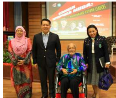
PWU bersama pembicara jemputan

Seminar ini diharapkan dapat dijadikan wadah perkongsian ilmu untuk menjana kepimpinan sektor awam melalui transformasi diri, membentuk bakat kepimpinan muda dan melahirkan pemimpin-pemimpin muda tanpa mengira rupa dan umur bagi memperkukuhkan sistem penyampaian perkhidmatan.