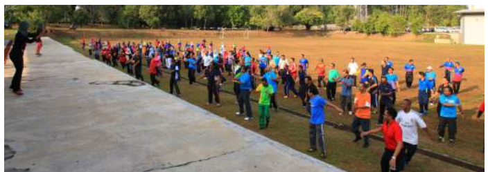
Sambutan yang menggalakkan daripada para peserta

S elepas penganjuran Program 10,000 Langkah pada 20 Mac lalu, sekali lagi INTAN Wilayah Utara dengan kerjasama Jabatan Belia dan Sukan Daerah Kuala Muda telah menganjurkan Senamrobik Perdana pada 18 April 2016 bertempat di Astaka INTURA. Seramai hampir 150 orang peserta yang terdiri daripada warga INTURA dan peserta kursus hadir menjayakan sesi senamrobik ini. Sesi senamrobik ini telah dikendalikan oleh tenaga pengajar dari Amy Studio. Senamrobik ini mendapat sambutan yang menggalakkan dan diharapkan program ini dapat diteruskan dari semasa ke semasa bagi menggalakkan penjawat awam khususnya peserta kursus supaya lebih aktif dan pembelajaran tidak terhad di dalam kelas sahaja serta membudayakan gaya hidup sihat.