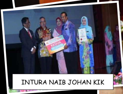
INTURA NAIB JOHAN KIK