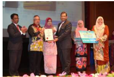
INTAN Bukit Kiara Johan Anugerah Inovator

Pegawai Sukar Dikesan ’ melalui satu sistem yang dikenali sebagai Sistem Pergerakan Pegawai (i-Gerak) . Mereka telah berjaya membawa pulang sijil, plak, dan wang tunai berjumlah RM 2000. Johan telah dimenangi oleh Kumpulan The Contractors dari Bahagian Pembangunan dan Pengurusan Maklumat Strategik (BPMS), JPA. Mereka turut membawa pulang sijil, plak, dan wang tunai berjumlah RM 3000.