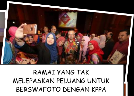
RAMAI YANG TAK MELEPASKAN PELUANG UNTUK BERSWAFOTO DENGAN KPPA