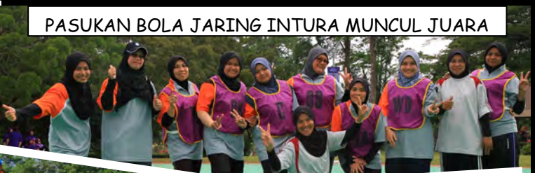
PASUKAN BOLA JARING INTURA MUNCUL JUARA