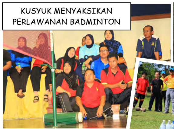
KUSYUK MENYAKSIKAN PERLAWANAN BADMINTON