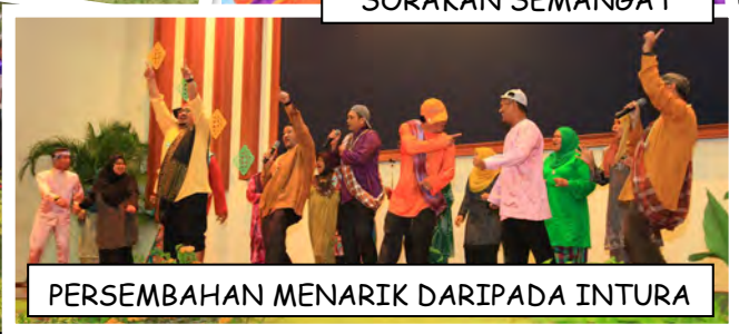
PERSEMBAHAN MENARIK DARIPADA INTURA