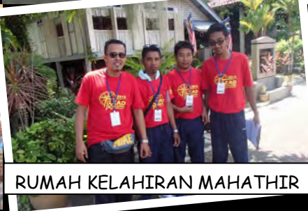
RUMAH KELAHIRAN MAHATHIR