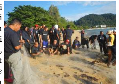
Aktiviti memukat ikan

secara berpasukan di Pulau Pangkor. Pelbagai aktiviti yang melibatkan pasukan seperti problem solving , orienteering , memukat ikan, dan war game telah diaplikasikan sepenuhnya oleh konsultan sepanjang sesi ini berlangsung.