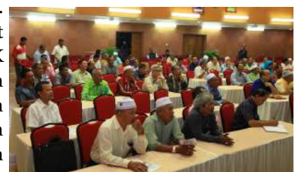
Antara JKKK yang hadir