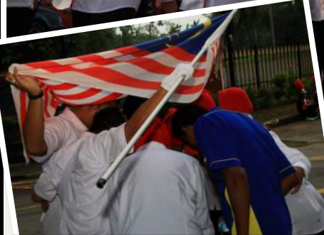
NI DOK PASANG STRATEGI KA DOK TENGAH MENGUMPAAT?

APA PERASAAN ENCIK BILA INTURA DINOBATKAN SEBAGAI NAIB JOHAN?