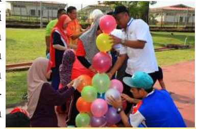
Membina menara belon

Tujuan utama kursus ini dijalankan adalah untuk memberi pendedahan asas dalam pembangunan skil kepimpinan berkumpulan yang