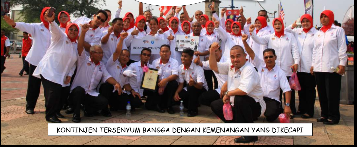
KONTINJEN TERSENYUM BANGGA DENGAN KEMENANGAN YANG DIKECAPI