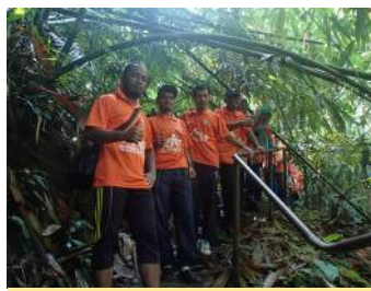
Kembara di Pengkalan Hulu

diperlukan oleh Team INTAN menerusi outdoor leadership training . Selain daripada itu, elemen jaringan hubungan antara Team INTAN juga turut diterapkan untuk melahirkan warga INTAN yang proaktif, produktif dan inovatif di mana setiap warga dibahagikan mengikut kumpulan secara rawak. Ini secara tidak langsung dapat